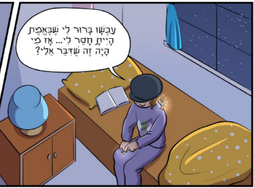
המשך: יבוא בעז"ה

לקבלת העלון להפצה בבית הכנסת חינוג: 02-5379160 שלוחה 0