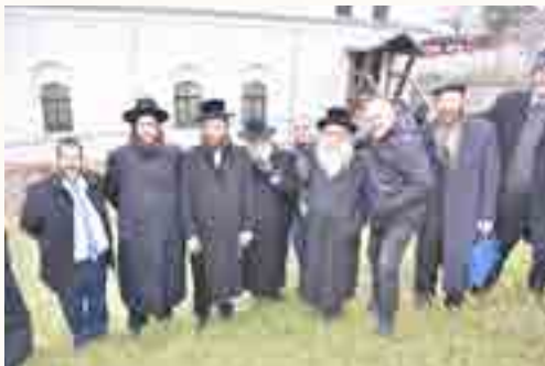
בתפילה בקבר החתן והכלה בחצר בית הכנסת העתיק של האוהב ישראל מאפטא בעיר יאס