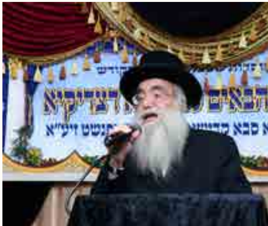
בדרשתו בהילולא דצדיקא בשטפנשט

לפני שאתחיל לדבר מעניני סיום מסכת ברכות אומר כמה מילים על המצב בו שרויים אנו כעת, בנהוג שבעולם כשנוסעים במטוס אז לפני הנחיתה מכריזים לסגור את החגורה, רבות! זה המצב כעת בו מכריזים מהשמים כביכול שאנו עומדים לנחות, היינו בגלות כמעט 2000 שנה, כלל ישראל עבר מצבים קשים, אבל כל אחד מבין וכל אחד יודע שהמטרה של הכל זה ביאת המשיח שזה עוד לא היה עד עתה, אנחנו הרי בנינו של הקב"ה, ואנחנו נמצאים בכזה גלות, איך זה יתכן שזה המצב של הקב"ה, האם הגלות זה המטרה של הבריאה? זה הרי לא יתכן, אלא ודאי, כל הגלות זה ההכשר כדי שנגיע למטרה האמיתי שהמשיח יבא, וכן כתוב בדעת תבונות מהרמח"ל שמבריא את העולם כל מה שהקב"ה עושה הכל זה להביא לימות המשיח, זה המטרה, והמצב האידיאלי של הבריאה שמשיח יבא וכל אחד יכיר באמת, עכשיו אנחנו במצב של הסתר פנים ואנחנו עוד לא ראינו.