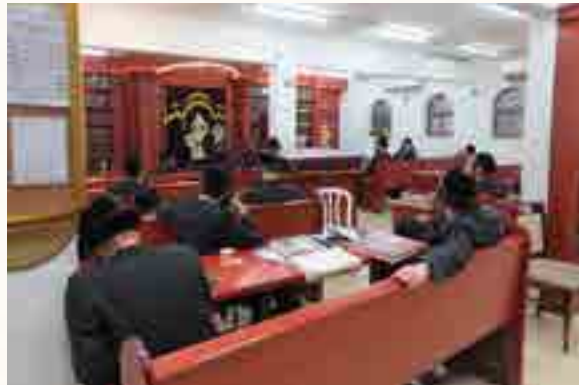
נושא דברי התעוררות ככולל הרבנים שטפנשט

מרגליות אשר שפתותיו נוטפות שושנים מדרשים מתובלים בראייה היסטורית וגם עכשווית, זכורה ביותר דרשתו בסיום זמן החורף, בעת פרוץ מגפת הקורונה העולמית כאשר בעצם שהיה נראה אז כסיומא דעלמא, לרבים מבאי בית מדרשינו זכורה דרשתו המקיפה המנתחת את הקורה בעולם בהימוט מוסדות תבל, וראה להלן את הדרשה במלואה. ואכן היה הרב זצ"ל אמן בהחדרת אמונה לקהל שומעי לקחו, ואת עיקרי חידושי ודרשותיו הדפיס בספריו 'שורשי אמונה' על אמונה ובטחון חסידות ועל הש"ס, ובשנה האחרונה שכבר קשתה עליו הדיבור, הביא את רעיונותיו בכתובים בגלינות 'חוסן האמונה'.