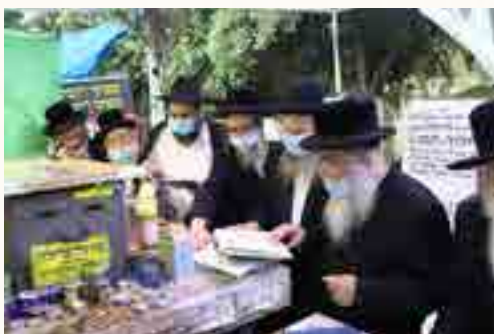
בתפילה בציון הקודש בגבעתיים ביומא דהילולא של שנת הקורונה, כאשר הוא הצטרף למעמד 'שלוחי עמך' - הרבנים המעתירים בעד כלל ישראל במשך כל שעות ההילולא בשם כל ישראל