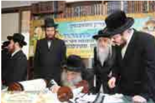
ועתה כתבו לכם - בהכנסת ס"ת לביהמ"ד שטפנשט לידו עומד האדמו"ר מקראלי זצ"ל

עבודת התפילה של הרב המנוח ז"ל הייתה לשם דבר, ובהזדמנויות רבות בהם התפלל בבית מדרשינו, יכלו המתפללים לשאוב מהסתכלות עליו מלא חופניים יראת שמים ולימוד אמיתי כיצד צריך לעבוד את הבורא, מספר ידיו מנוער ילחט"א הגה"צ רבי יוסף