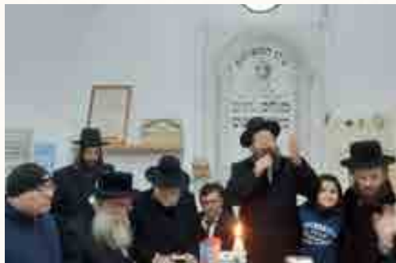
בתפילת רבים בציון המצוינות של הרה"ק אדמו"ר הראשון משטפנשט באהל הצדיק ביאס רומניה ביום ההילולא קדישא

בחודשים האחרונים, למרות המחלה שקיננה בו, למרות שקשתה עליו ההליכה התאמץ במסירות נפש ממש להגיע ללמוד וללמד בביהמ"ד שטפנשט ברחוב מהרש"ל, ואף שהיה נצרך לסיוע בהליכתו לא ויתר לעצמו, ודאג שיוכל להגיע ולחזור בבטחה לביתו עם מלוים ונהגים, העיקר לא להפסיד ולהחסיר ולו יום אחד של 'שבתי בבית השם'.