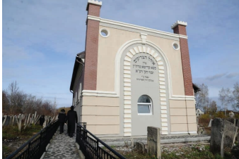
אוהל הרה"ק רבי ישראל מרוז'ין זי"ע ובניו, בעיר סאדיג'ורא

תחילה עמד גדליה כמאובן על מקומו, חש כמי שנפל לפח ויקשים, אלא שמשמים חננוהו באותם רגעים בכוחות איתנים ובדעה מושכלת. התבונן גדליה סביבו, ותכנן בקור-רוח את צעדיו. נטל חיש את גרתיק התפילין שלו, ומבעד לחלון הלא-מסורג ניתר קומה וחצי על הקרקע הבטוחה, וכך, ללא שום